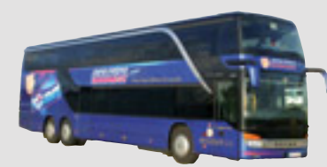
3 x Setra 431 DT 66 sièges Royal Class - 13,80 m, mis en service en janvier 2005, janvier 2006 et mai 2007

Un confort testé et approuvé ! une exclusivité