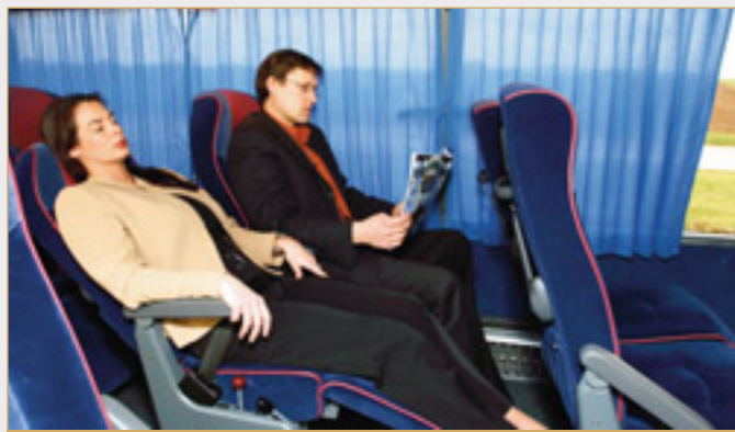
Fauteuils Royal Class (Vanhool 917 T9) : le summum !