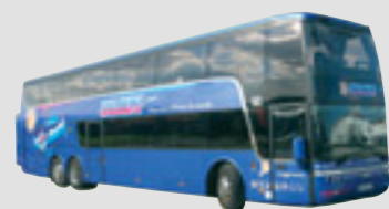
2 x Van Hool Astromega 66 sièges Royal Class - 14,10 m, mis en service en janvier 2006 et juin 2007