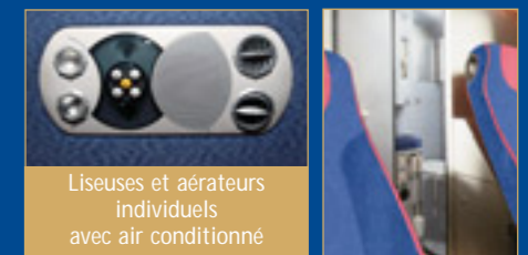
Liseuses et aérateurs individuels avec air conditionné

INCROYABLE ! Comme dans les avions, suivez votre itinéraire grâce à nos systèmes GPS.