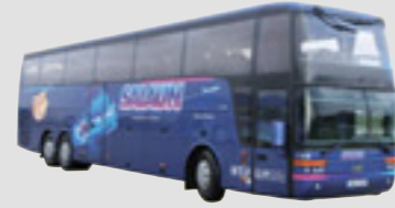
2 x Van Hool Altano T9 48 sièges Royal Class - 13,80 m, mis en service en janvier et août 2004