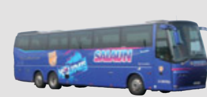
Bova Magic 44 sièges Royal Class - 13,80 m, mis en service en février 2006