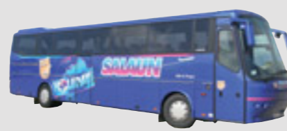
10 x VDL Bova FHD 13 40 sièges Royal Class - 12,80 m, mis en service en janvier 2006 et 2007