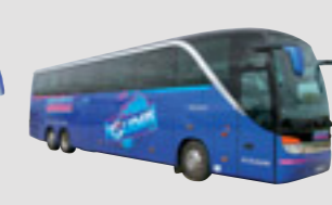
2 x Setra 417 HDH 56 sièges Royal Class - 13,80 m, mis en service en 2006