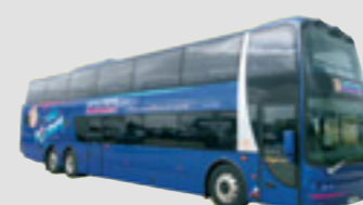
3 x VDL Bova Synergy 66 sièges Royal Class - 13,80 m, mis en service en janvier 2006 et 2007